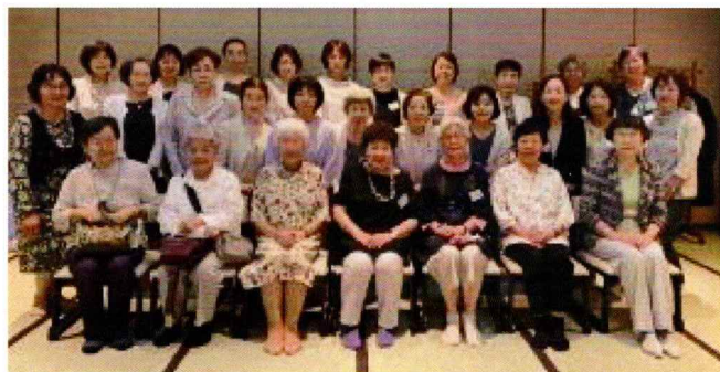
令和5年度佐保会静岡支部総会 ～茄子の花 無庵にて～

令和5年6月11日(日)11:45～15:30 会場：無庵、静岡市歴史博物館 参加者 28名